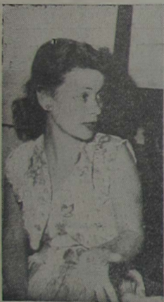
A bailarina Ivete Braga