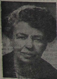
Sra. Anna Eleanor Roosevelt

Após referir-se a outras tarefas realizadas com êxito pelo Fundo Internacional, friza que até 1 de julho de 1952, as contribuições individuais e governamentais para a UNICEF atingiram 165 milhões de dólares.