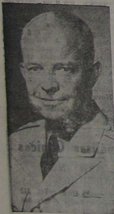
Gen. Dwight D. Eisenhower, eleito Presidente dos Estados Unidos por esmagadora maioria.