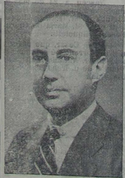
Adlai E. Stevenson, que perdeu o pleito como candidato à Presidência dos EE. UU. pelo Partido Democrático.

— CINQUENTA E SETE países dão direito de voto às mulheres. O primeiro desses países foi a Nova Zelândia, em 1893, e o último foi a Grécia, em 1951.