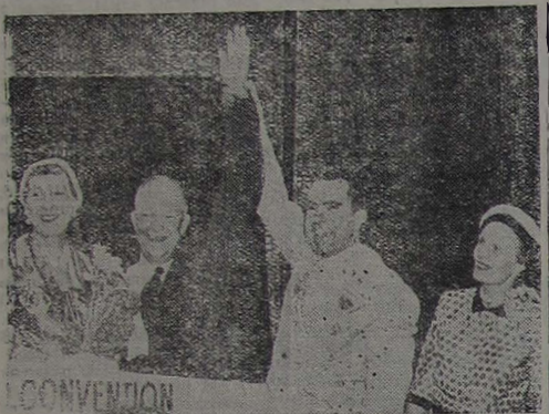
O gen. Dwight D. Eisenhower, novo presidente dos Estados Unidos, tem seu braço erguido pelo vice-presidente eleito, Richard Nixon. Esta foto foi tirada quando da Convenção Republicana, em Chicago.

Logo depois da guerra, ingressou na Escola de Estado