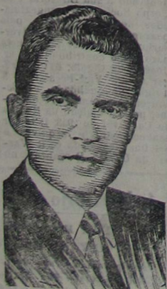
Richard M. Nixon, candidato do Partido Republicano que venceu as eleições para Vice-Presidente.