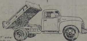
Chassis de 137" entre eixos. Capacidade para 1,50 m3 até 2 m3.

Os caminhões Chevrolet estão sempre presentes no árduo trabalho de abrir caminhos para o progresso econômico do Brasil. Nessa patriótica tarefa de construir estradas, os caminhões Basculantes Chevrolet são os mais eficientes no transporte de terra, calçamentos, etc. Inteira mente de chapas, com reforço em toda a extensão das laterais, os Basculantes Chevrolet oferecem carroceria facilmente levantada por meio de um aparelho hidráulico acionado pelo motor, simplificando a operação de descarga. Proporcionam maior resistência e mais espaço. Os caminhões Chevrolet são mais baratos porque duram mais tempo na estrada - fazem mais tempo na estrada.