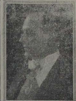
Presidente Getúlio Vargas

Nova Igassú e teve em festa ontem, pela manhã, para receber a honrosa visita do sr. Presidente da República, do sr. Governador do Estado, do sr. Diretor dos Correios e Telégrafos, do sr. Diretor da Central do Brasil e demais autoridades estaduais e federais. Decretado feriado municipal, todo o comércio cerrou suas portas, bem assim a indústria que cessou suas atividades, podendo dessa maneira atender ao apêlo do governo municipal para associar-se às homenagens àqueles ilustres homens públicos. Houve parada das escolas publicas e particulares e muito movimento no centro da cidade.