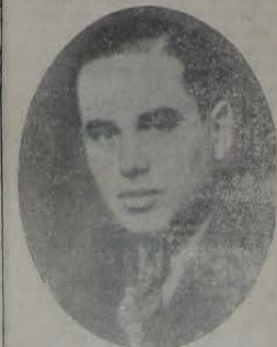
Governador Amaral Peixoto

O dr. Getúlio Vargas, acompanhado de sua comitiva, chegou a esta cidade às 11 horas, indo diretamente à nova Agência dos Correios e Telégrafos, à rua Otávio Tarquínio, cuja inauguração oficial teve oportunidade de presidir, presentes autoridades municipais, estaduais e federais.