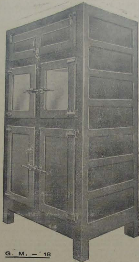
G. M. - 18