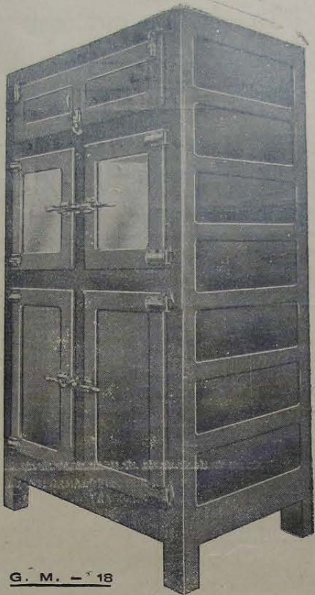
G. M. — 18