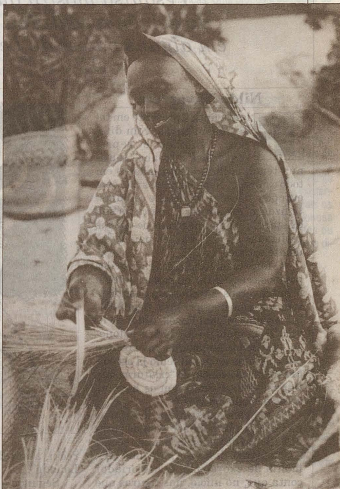
Algumas mulheres negras estão rejeitando seu padrão de beleza

geral desse órgão, "embora a maioria dos produtos de beleza tenham efeitos colaterais, não se comparam às substâncias branqueadoras, pois estas causam sérios danos à saúde humana".