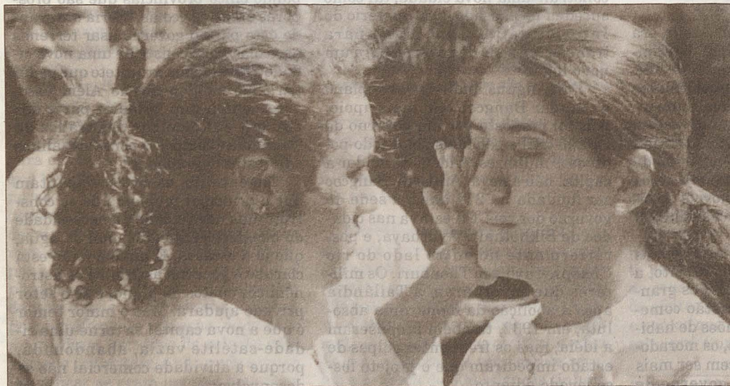
Para muitos jovens, é basicamente a imagem que conta na hora de selecionar o seu grupo social

As “tribos” analisadas por Sabsay se nucleiam e se diferenciam pela forma como se vestem, a maquiagem, as cores, o penteado, isto é, por todo um “discurso audiovisual”. ■