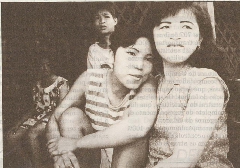
No comércio do sexo com jovens, os meninos são os preferidos dos turistas europeus

Direitos violados - No Sri Lanka, onde o turismo é uma das maiores fontes de divisas para o governo, há divergências em relação ao número de crianças envolvidas. Mas em Kalutara, cidade costeira que fica a 25 quilômetros de Colombo, capital do Sri Lanka, o diretor de uma escola revelou que cerca de 500 crianças tinham