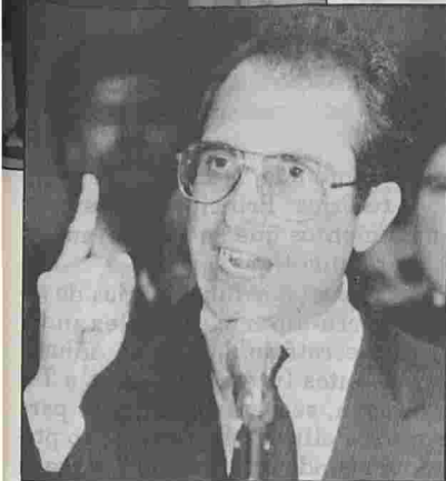
Ernesto Zedillo: uma incógnita