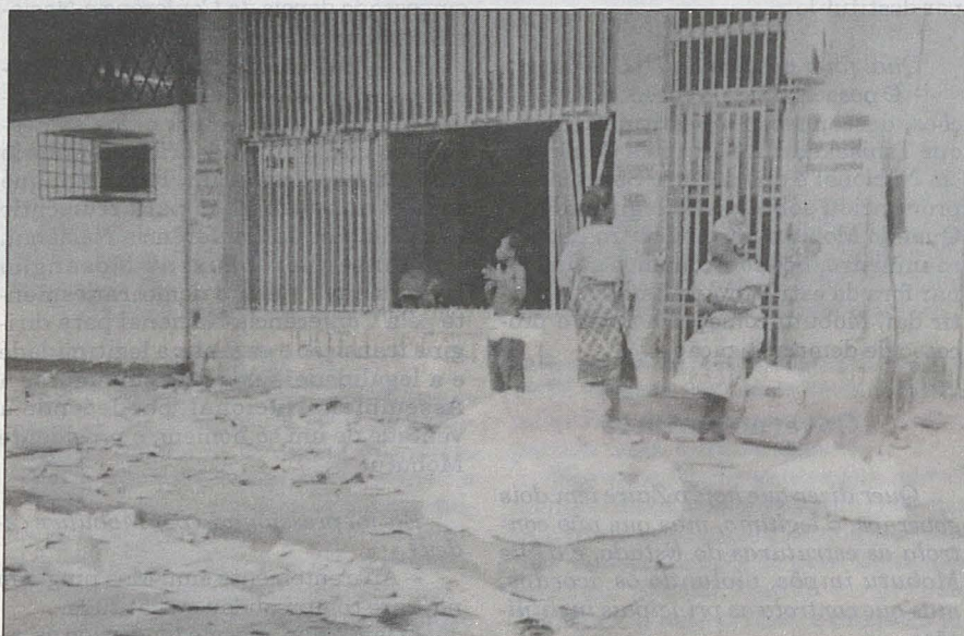
Militantes da oposição fazem um protesto em frente ao palácio presidencial

— Assegurar a realização de eleições livres e transparentes com observadores internacionais.