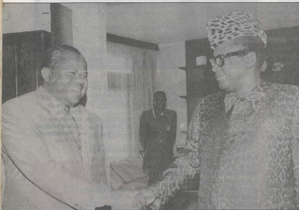
Tshisekedi cumprimenta Mobutu (dir.) ao ser designado primeiro-ministro em 1991

Depois de ter concordado com a democratização, o ditador zairense voltou atrás e provocou uma crise que o desgastou perante o povo, revoltado com a corrupção nas esferas do poder