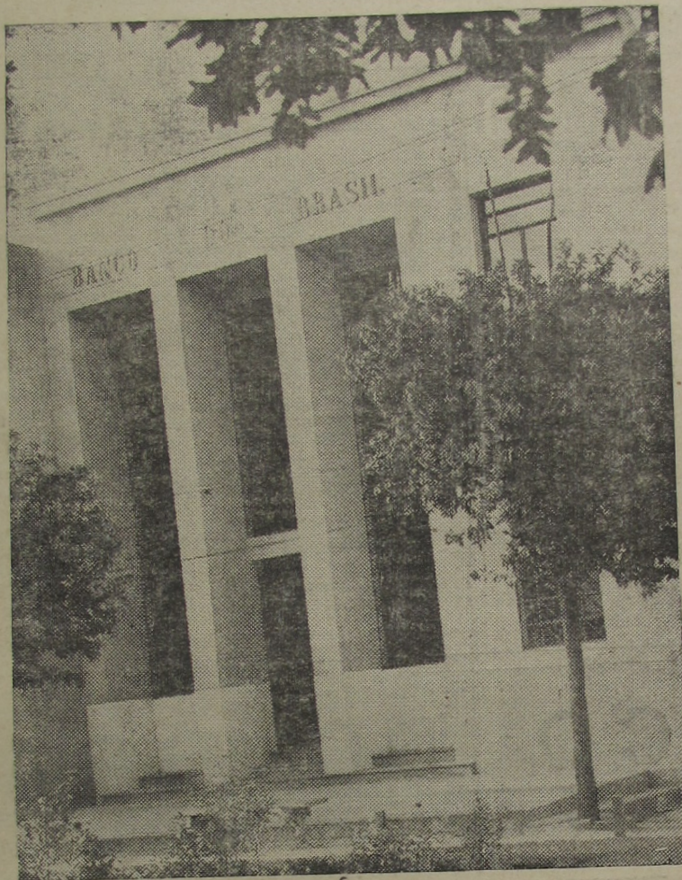
FRENTE DO NOVO EDIFICIO DA AGENCIA DO BANCO DO BRASIL S/A