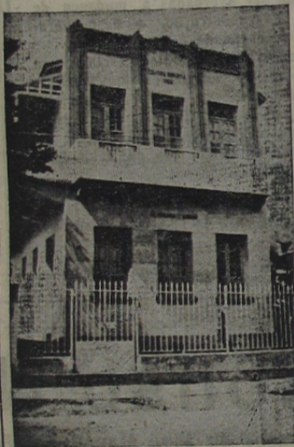
Edifício do Centro Espirita "Fé, Esperança e Caridade"

Lede-o, analisando-o, que ganhareis vosso tempo, e o dinheiro com que o oblitvestes.