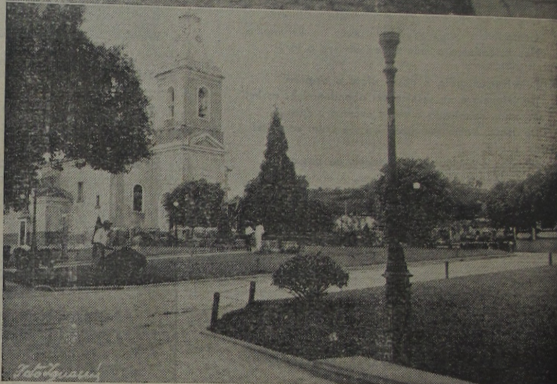
DE VILA MERITI — Trecho calçado da rua da Matrix, e a Praça da Bandeira, na sede do 4º distrito.