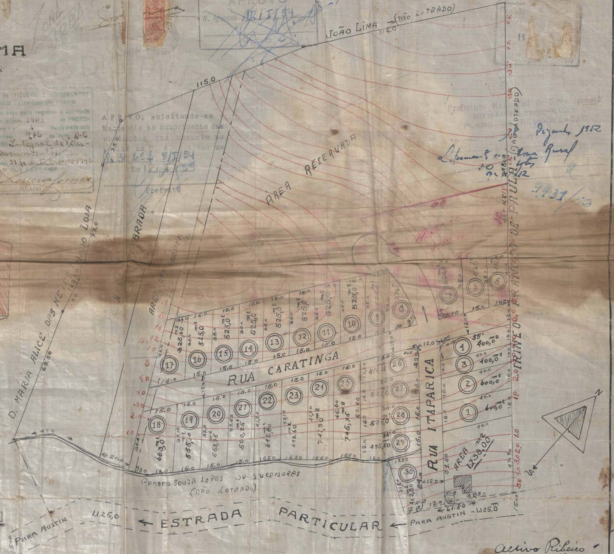
ESCALA - 1:1.000

Activo Ribeiro Cart. n.º 30 do C. R. & A.