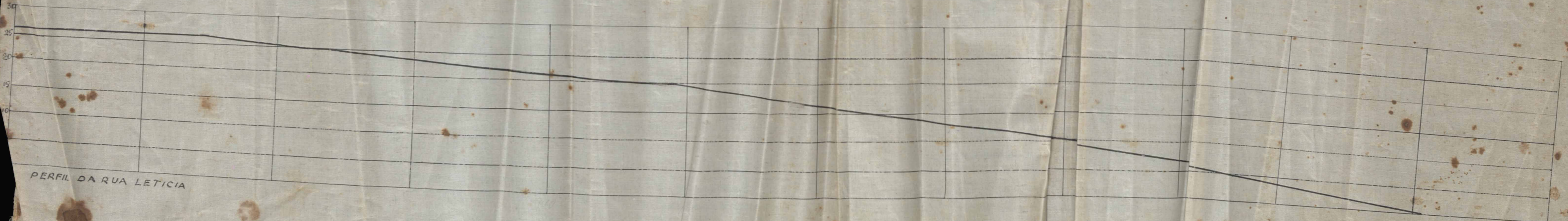
PERFIL DA RUA LETICIA

PROVA... Recebe... orig... assin... 2. 16... E. D. RIO