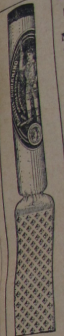
FOGUETE ADRIANINO tamanho reduzido

em Novembro Para todos preferir fogões, que são ischa e são ischa