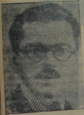
DR. FRANCISCO CAMPOS Ministro da Instrução Publica

O Governo Provisorio acaba de baixar um decreto officializando o accordo orthographico recentemente celebrado entre a nossa Academia de Letras e a Academia de Sciencias de Lisboa, com o fim de simplificar a "escripta" daqui e d'alem mar, até hoje tão embaralhada e que pelo accordo não sabemos se ficará mais confusa.