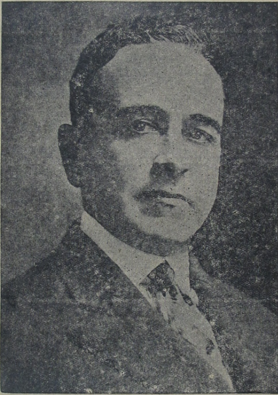
Dr. Getulio Vargas CHEFE DO GOVERNO PROVISORIO

ção que contemplamos o local onde já foram collocados os primeiros alicerces do futuro hospital da nossa cidade, á Praça do Forum, á esquerda do grande edificio que dá o nome ao logradouro. Sim porque a realisação dessa obra inestimavel de assistência publica aos nossos recesitados, que os ha em grande numero em nosso municipio, com de resto em toda parte do solo patrio; importa nua das mais bellas victorias conquistadas por campanhas de guerra por esta f lha.