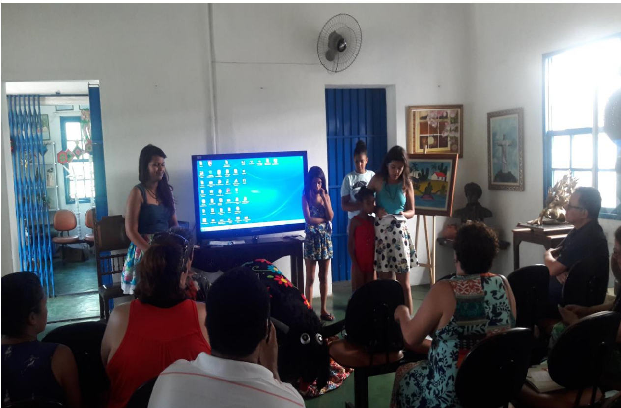
Fotografia 5: Registro feito da Apresentação do Testamento do Boi Gentileza pelos Jovens Agentes do Patrimônio durante a Prestação de Contas do Museu Vivo do São Bento 11/12/2018 (Arquivo Pessoal)