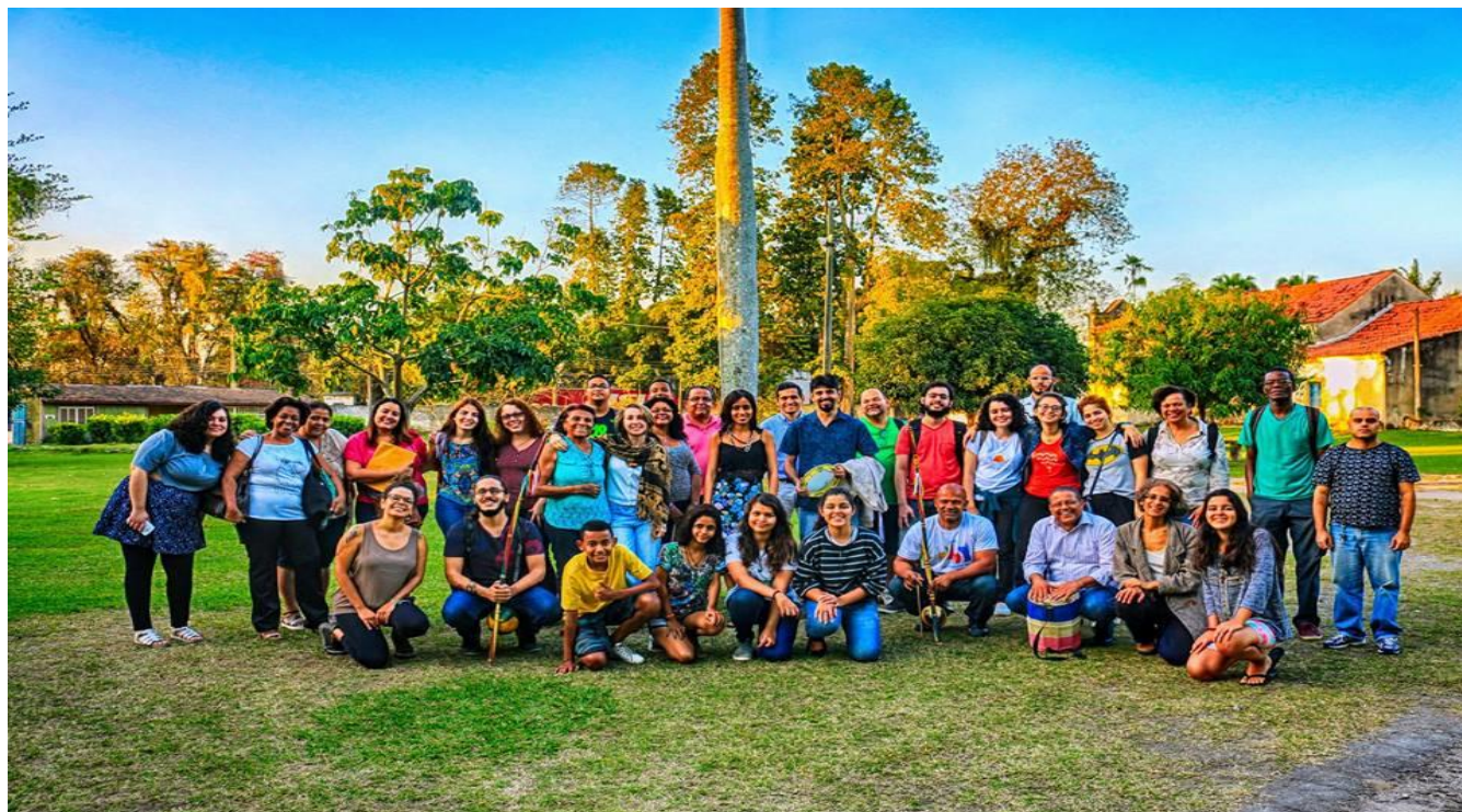
Fotografia 2: Registro dos participantes do Curso de Inventário Participativo realizado no Museu Vivo do São Bento. A foto encontra-se disponível na página do Museu no Facebook: < https://www.facebook.com/museuvivodosaobento/photos/a.849540675167049/1409324205855357/?type=3&theater > Último acesso em 11 de jan. de 2019.