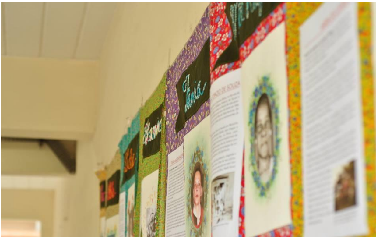
Fotografia 1: Exposição "Mulheres em movimento na Cidade de Duque de Caxias" exposta no 1º Encontro de Pós-Graduandos em História e Patrimônio UFRRJ, evento realizado na UFRRJ campus Nova Iguaçu. A foto encontra-se disponível na página do evento: < https://www.facebook.com/encontrohistoriaepatrimonio/ > Último acesso em 11 de jan, de 2019

A pesquisa “Tempo da Conquista Lusitana” desenvolvida em parceria com o CRPH, desperta, na população, por sua vez, o interesse em conhecer a História da região ao fomentar o conhecimento sobre o território da antiga Fazenda do Iguaçu e das Cercanias da Guanabara no século XVI. Compreende-se que,