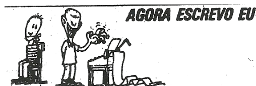
Ilustração que simbolizava a seção de cartas do Jornal da Baixada .