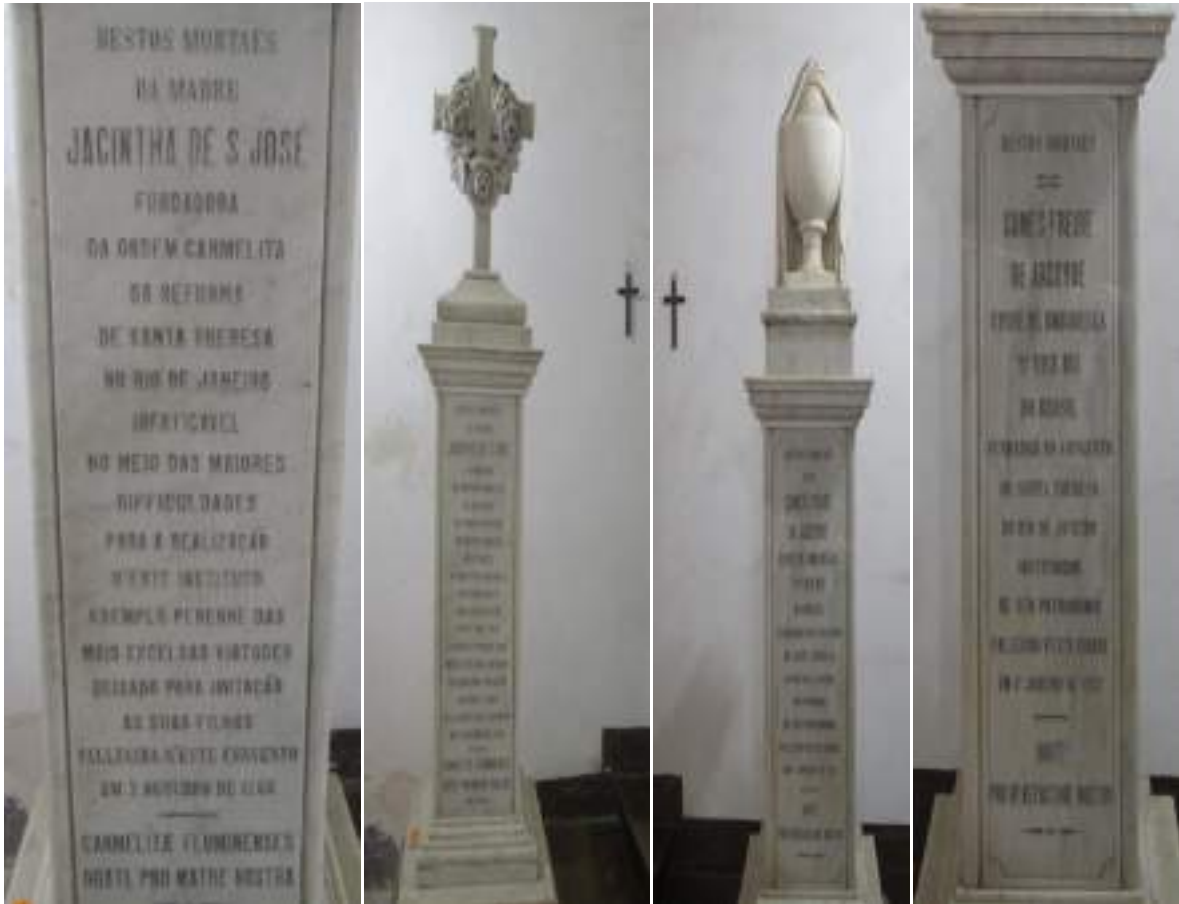
Figuras 4 e 5: Referem-se aos restos mortais de Jacinta de São José que, até hoje, fica em local de destaque na sala das catacumbas do Convento de Santa Teresa. A foto é atual e foi cedida pelas freiras do Convento. (ACST-RJ, 21 de março de 2019)