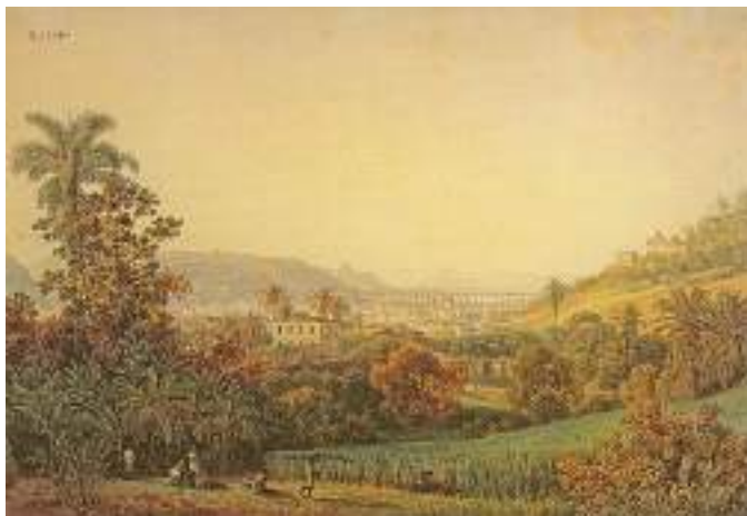
Figura 1: ANSICHT von der Anhöhe Matta Cavallos nach der Wasserleitung von Rio de Janeiro [Vista da Colina Mata Cavalos, em direção ao aqueduto do Rio de Janeiro]. In: ENCICLOPÉDIA Itaú Cultural de Arte e Cultura Brasileiras. São Paulo: Itaú Cultural, 2019. Disponível em: < http://enciclopedia.itaucultural.org.br/obra60924/ansicht-von-der-anhoehe-matta-cavallos-nach-der-wasserleitung-von-rio-de-janeiro-vista-da-colina-mata-cavalos-em-direcao-ao-aqueduto-do-rio-de-janeiro >. Acesso em: 30 de Jul. 2019. Verbete da Enciclopédia. ISBN: 978-85-7979-060-7.

Rio de Janeiro, data do início do século XIX e atesta quão rural era a localidade em que estava situada a Chácara da Bica.