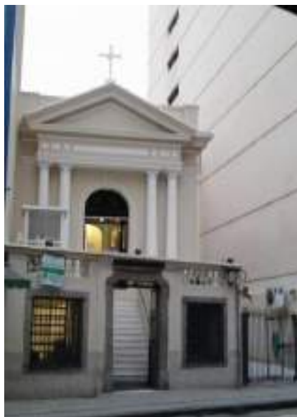
Figura 2: Fotografia da Capela do Menino Deus, reconstruída pela Sociedade de São Vicente de Paulo (em 1924) encontra-se localizada na atual Rua do Riachuelo nº75, provavelmente, conservada no local primitivo da Chácara da Bica. (Arquivo pessoal. Out. 2015).

Outro aspecto a ser destacado na análise da trajetória de Jacinta e de sua irmã é o fato de não terem ingressado no Convento de Nossa Senhora da Ajuda. Na década de 1730, período que a família das jovens requereu a autorização da coroa para ingressarem num Convento em Portugal, realmente não havia um convento oficialmente encerrado a clausura papal em terras fluminenses. Mas, já havia um movimento para a confirmação canônica do Recolhimento da Ajuda. Desde 1741, com a posse no bispado de D. Fr. João da Cruz, a construção do convento feminino da Ajuda foi restabelecida. O bispo adotou providências para a realização da obra, solicitou esmolas da população e comprou imóveis para favorecê-la. Por fim, lançou a pedra de fundação do convento em maio de 1742. 155 Ou seja, apenas dois meses depois de finalizada a compra da Chácara da Bica, que se efetivou em março do mesmo ano.