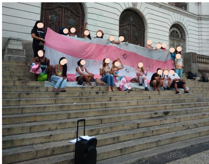
Figura 1: Ato de Visibilidade Travestigênera.