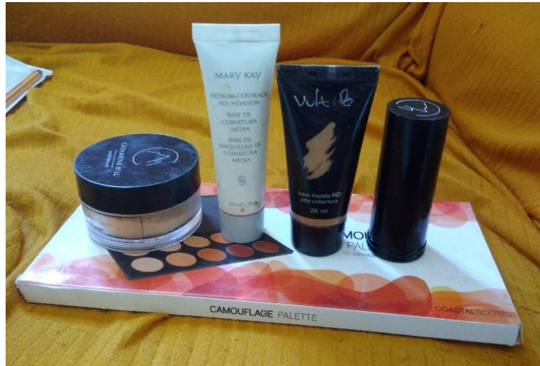
Figura 4: Maquiagens utilizadas pela entrevistada Maria.