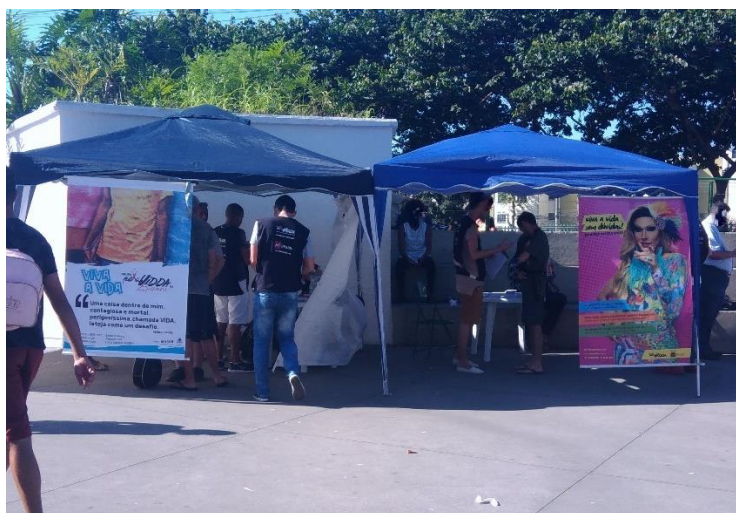
Figura 2: Tenda do Grupo Pela Vidda, que estava realizando testagem de HIV na Feira Colorida.